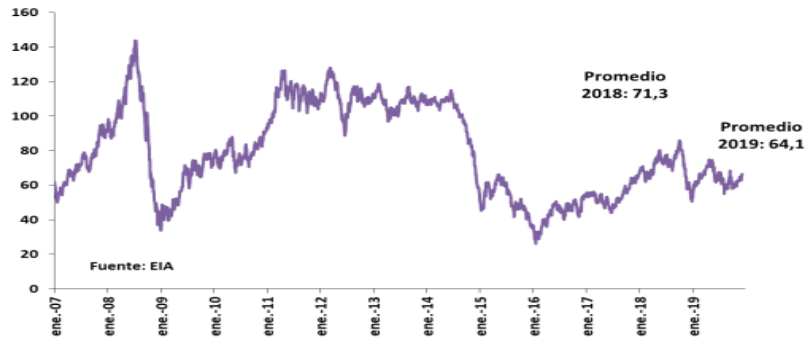
PRECIO PETRÓLEO BRENT (US$/BARRIL)

Gracias a la enorme devaluación del peso colombiano se esperan otras reacciones negativas en la economía, esta incertidumbre está generando un estancamiento en la inversión, incremento de precios de todos los sectores de bienes y servicios, como por ejemplo la disminución en el turismo que hoy en día es un rublo importante para las finanzas nacionales, pero no solo Colombia debe estar atento a este comportamiento de la economía, el mundo en general debe actuar de manera pronta para mitigar este nuevo coletazo económico.